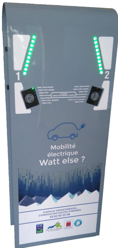
Borne DIVA SP

2 modèles de bornes sont à votre disposition. Des bornes simples DIVA SP de G2Mobility et des stations de plusieurs bornes EVlink City de SCHNEIDER.