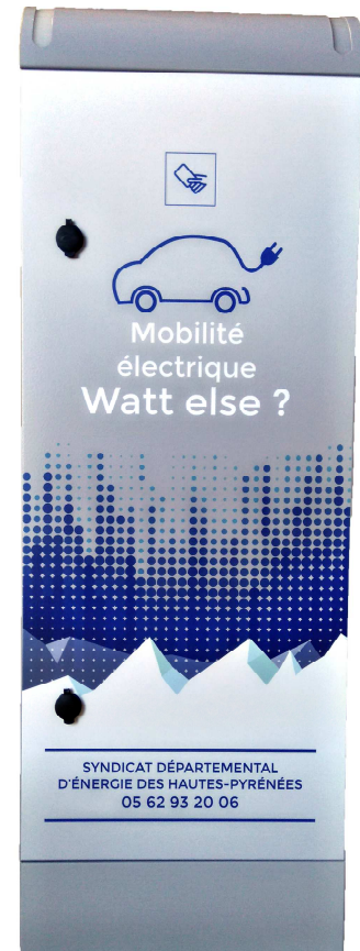
Borne EVlink City

Tout détenteur ou utilisateur de véhicule électrique ou hybride rechargeable : particulier, collectivité locale, service de l'Etat, entreprise, association... muni d'un badge fourni par le SDE65.