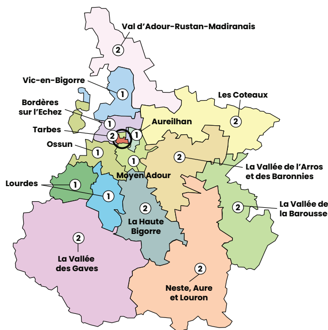
Nombre de délégués par canton